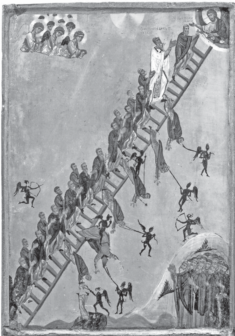
Лестница Иоанна Лествичника. XII в. Египет. Икона из монастыря св. Екатерины на Синае